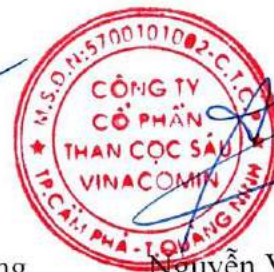
Nguyễn Văn Thuận