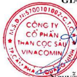
Nguyễn Văn Thuận