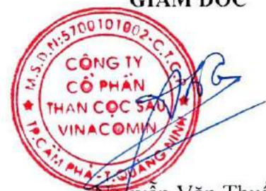
Nguyễn Văn Thuận